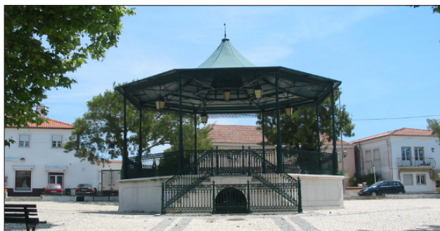
Coreto de S. João das Lampas

SAÚDA TODOS OS CANICULTORES PARTICIPANTES NAS EXPOSIÇÕES CANINAS DE SINTRA (NACIONAL E INTERNACIONAL) E DESEJA-LHES UM FIM-DE-SEMANA AGRADÁVEL NA SALOIA TERRA DE SÃO JOÃO DAS LAMPAS