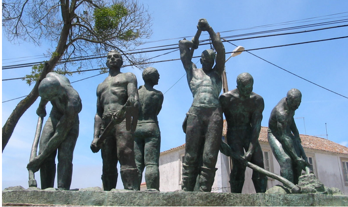
Escultura ao Trabalhador Agrícola

promovidas pela CÂMARA MUNICIPAL DE SINTRA organizadas pela COMISSÃO DE FESTAS DA VILA VELHA - SINTRA com a supervisão técnica do CLUBE PORTUGUÊS DE CANICULTURA o apoio das UNIÕES DAS FREGUESIAS DE SÃO JOÃO DAS LAMPAS E TERRUGEM e DE SINTRA e da SOCIEDADE RECREATIVA, DESPORTIVA E FAMILIAR DE SÃO JOÃO DAS LAMPAS e a colaboração da PURINA PROPLAN